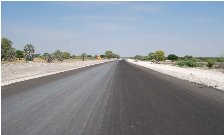
北部公路项目现场（河南国际公司承建）

根据纳米比亚公路局最新数据，纳米比亚公路总长度约为48875.27公里，其中B级沥青路7892.7公里、沙石路26046.5公里，土路13315.6公里，盐泥路299.9公里，多数路况良好。年平均旅客运输量5万人次，货运量18万吨。