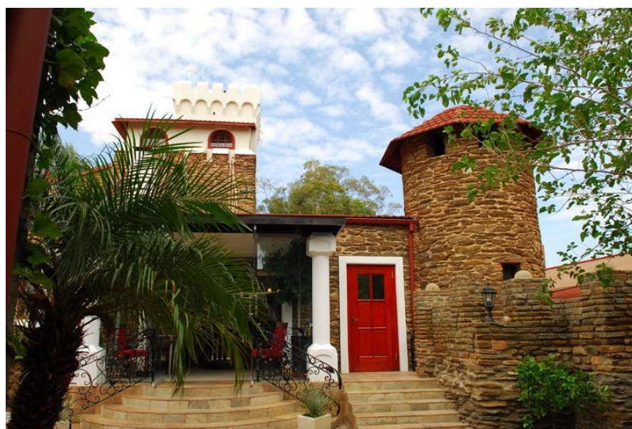
温得和克的城堡餐厅