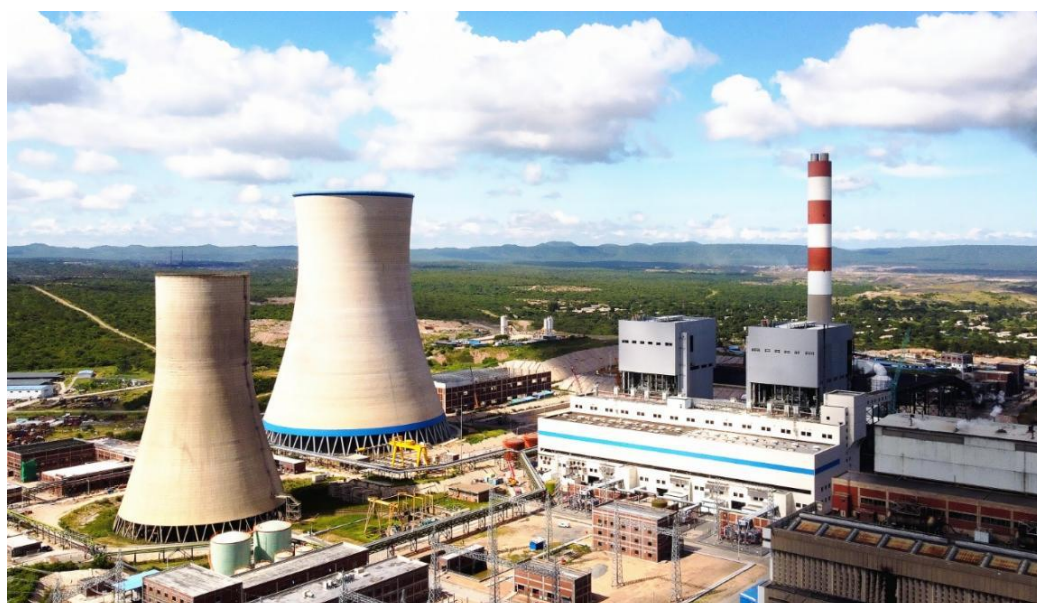
旺吉燃煤电站扩容项目