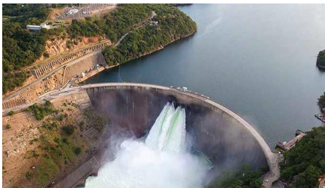
卡里巴南岸水电站

中国电建集团承建的卡里巴南岸水电站扩容项目，新增装机容量30万千瓦，2014年9月正式开工，已于2018年3月正式并网发电。中国电建集团承建的旺吉燃煤电站扩容项目，新建设两台单机30万千瓦燃煤机组，2023年3月和5月分别并网发电，输变电路计划于2023年底完工。两个电站扩容项目的投运极大改善津巴布韦电力供应不足的现状。此外，津巴布韦与赞比亚商讨在赞比西河共建巴托卡（Batoka）水电站项目，总装机容量2400兆瓦，但因种种原因已搁置。