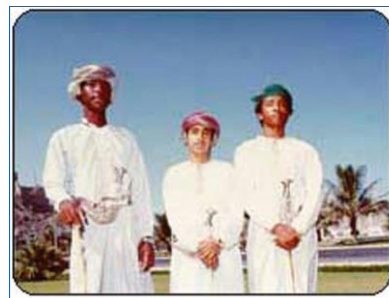
阿曼人的正式着装

【服饰】阿曼男子虽与大多数阿拉伯人一样穿无领长袖大袍、戴头巾，但有明显的不同：一是袍子的领口右侧垂有花穗，可以蘸注香水；二是头巾质地讲究，有很漂亮的花纹，扎缠在头，与沙特等国不同。在正式场合，男子一般习惯穿无领长袍，扎缠头巾，佩带弯刀，脚穿露出脚指的皮凉鞋。妇女喜饰金，服装艳丽。阿曼人能歌善舞，不过一般都是女歌男舞，男人在圈中欢快地跳舞，妇女则在外面以拍手唱歌伴舞。