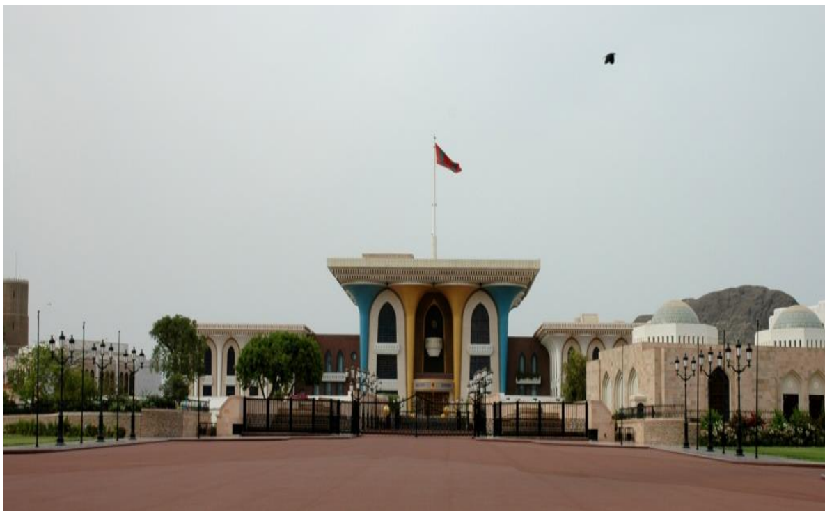
旗帜宫--苏丹重大礼仪活动地

萨拉拉（Salalah），阿曼最南端佐法尔省的首府和最大城市，阿拉伯半岛的乳香贸易中心也是通往印度洋的要道。萨拉拉港是阿拉伯半岛最大的港口之一，也是连接非洲、中东和亚洲的半岛上最重要的港口之一。位于港口旁边的萨拉拉自由区正在成为中东重工业的新中心。该地区的气候和季风使该市能够种植一些蔬菜和水果，例如椰子和香蕉。