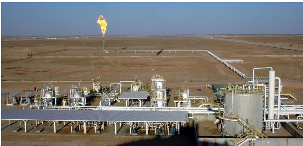
中石油阿曼5区块作业现场

【阿曼对华投资】2020年，阿曼投资局（OIA）与中国招银国际（CMBI）共同建立CMBI新动能基金。据OIA官网报道，基金规模至少为3亿美元，双方出资比例为50/50。基金通过证券市场投资中国境内的信息通信技术、新能源、医疗保健和物流等行业。