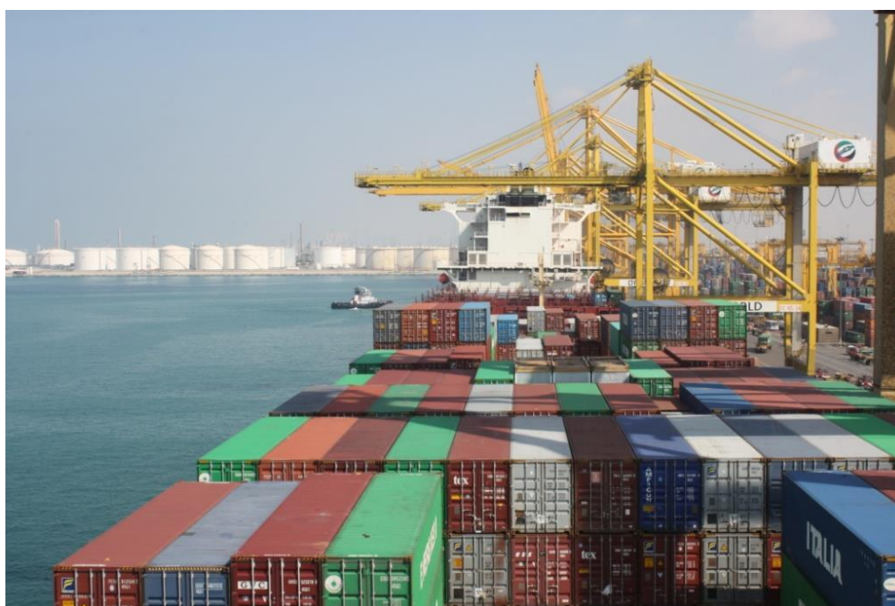
杰贝阿里集装箱码头

杰贝阿里港位于杰贝阿里自由区内，系世界最大的人工港，码头长15公里，有67个泊位，拥有世界一流的配套设施和服务。2013年，杰贝阿里港2号码头完工，年吞吐能力增至1500万标箱。目前，杰贝阿里港集装箱吞吐量居世界前10位，是中东北非地区第一大港，连续多年荣获中东最佳港口奖。