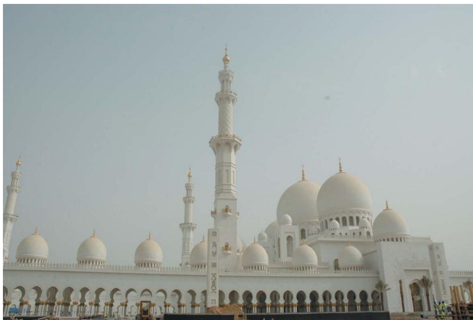
谢赫扎耶德清真寺

阿联酋是阿拉伯国家之一，国人信奉伊斯兰教，有着独特的生活方式、文化风俗和文化禁忌。