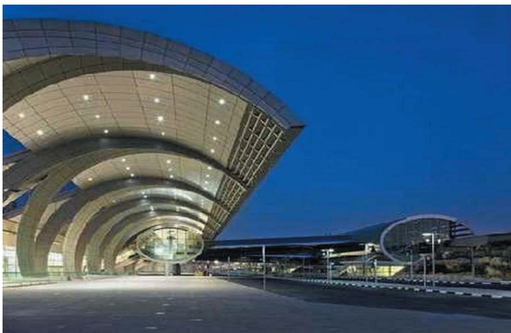
迪拜国际机场T3航站楼外景

阿布扎比机场建于1970年，目前只有一条跑道，2016年客运量约2450万人次。阿布扎比国际机场扩建项目总投资金额超过82亿美元，全部扩建工程最终完工后，空港廊桥将达到80个，年客运能力将超过5000万人次，空港区面积将超过3400公顷，能够满足未来40年来往阿布扎比的旅客流量需要。