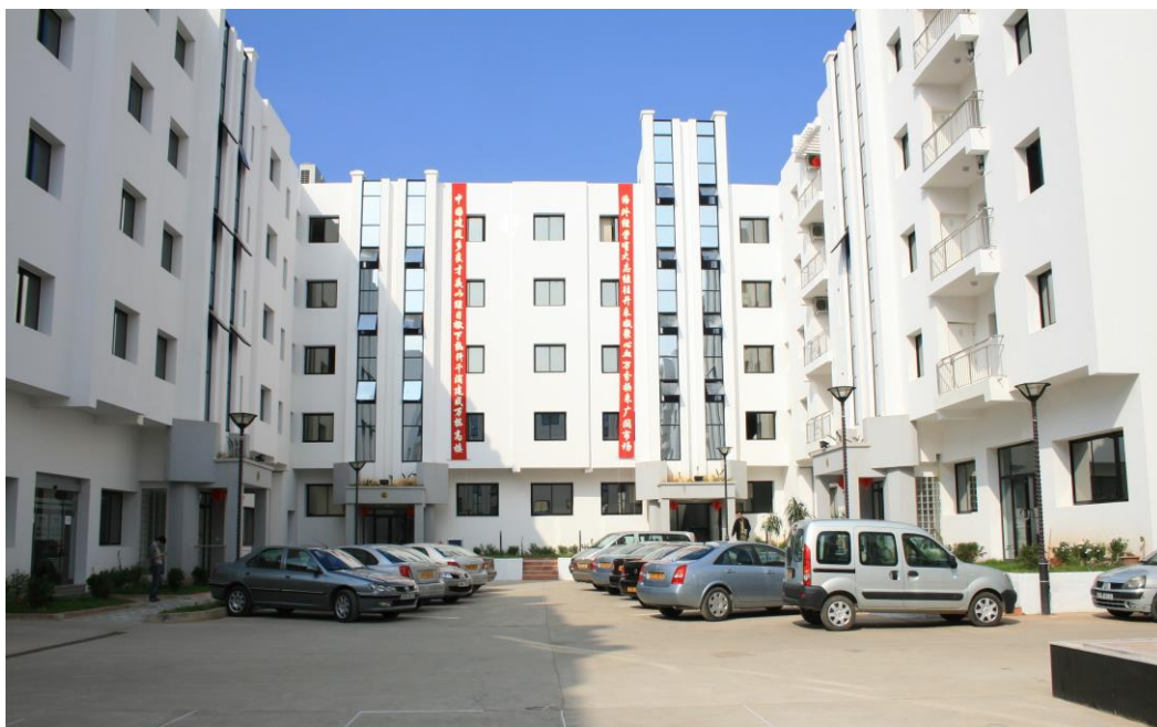
中国建筑股份有限公司驻阿尔及利亚经理部