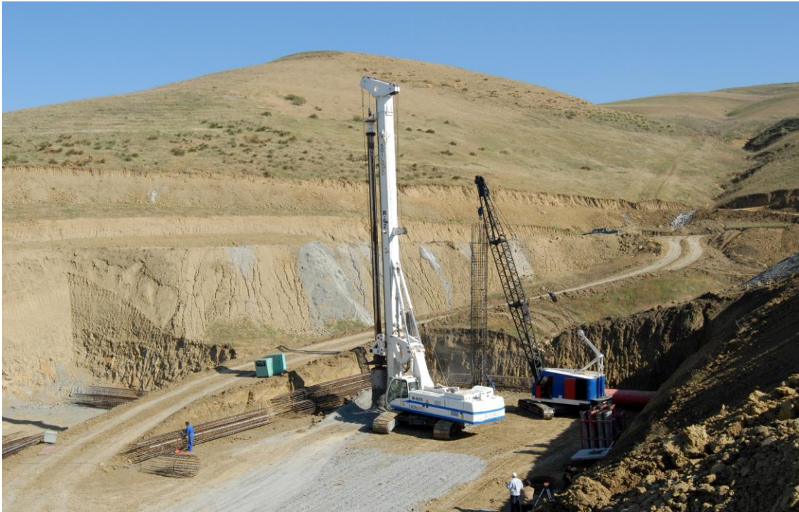
中信—中铁建联合体承建的東西高速公路

路项目、中建承建阿尔及利亚大清真寺项目、中冶承建奥兰体育场项目、中石油承建阿尔及尔炼厂改扩建（建设）项、中建承建南北高速路53公里项目、中铁建承建的贝贾亚高速公路连接线项目以及数个水利水坝项目；已进入收尾阶段的大项目有中国港湾承建的斯基克达油气码头改扩建工程，中国土木承建55公里铁路项目和175公里电气化铁路项目等。