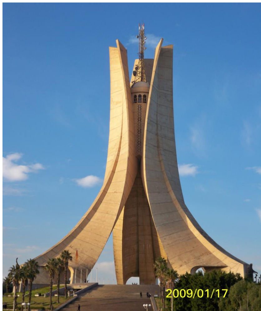
阿尔及尔标志性建筑——烈士纪念塔

阿尔及利亚地形分为地中海沿岸的滨海平原与丘陵、中部高原和南部撒哈拉沙漠三部分。沙漠面积逾200万平方公里，约占国土总面积的85%。阿尔及利亚属于东1时区，比北京时间晚7小时，没有夏令时。