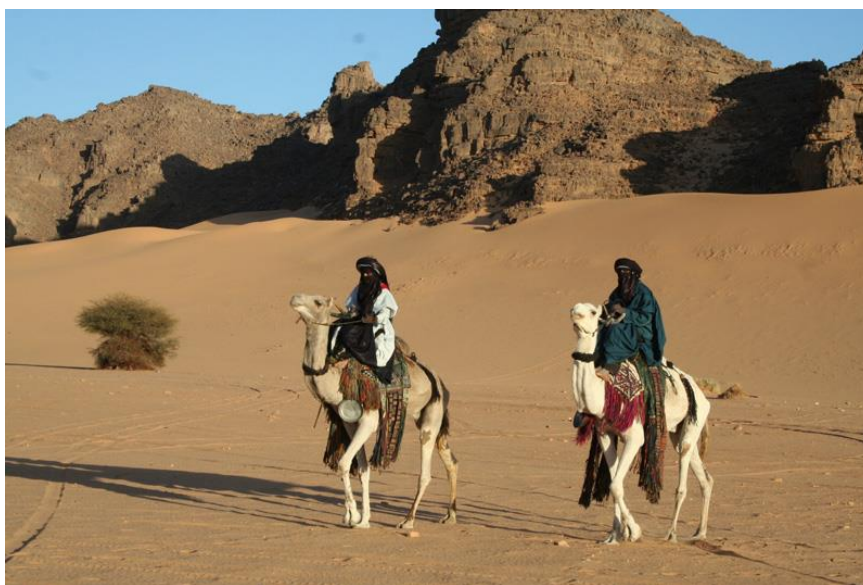
南部塔西里撒哈拉沙漠

量估计为1.5亿吨）、铀矿（5万吨）、黄金（173.6吨）、磷酸盐（20亿吨）。